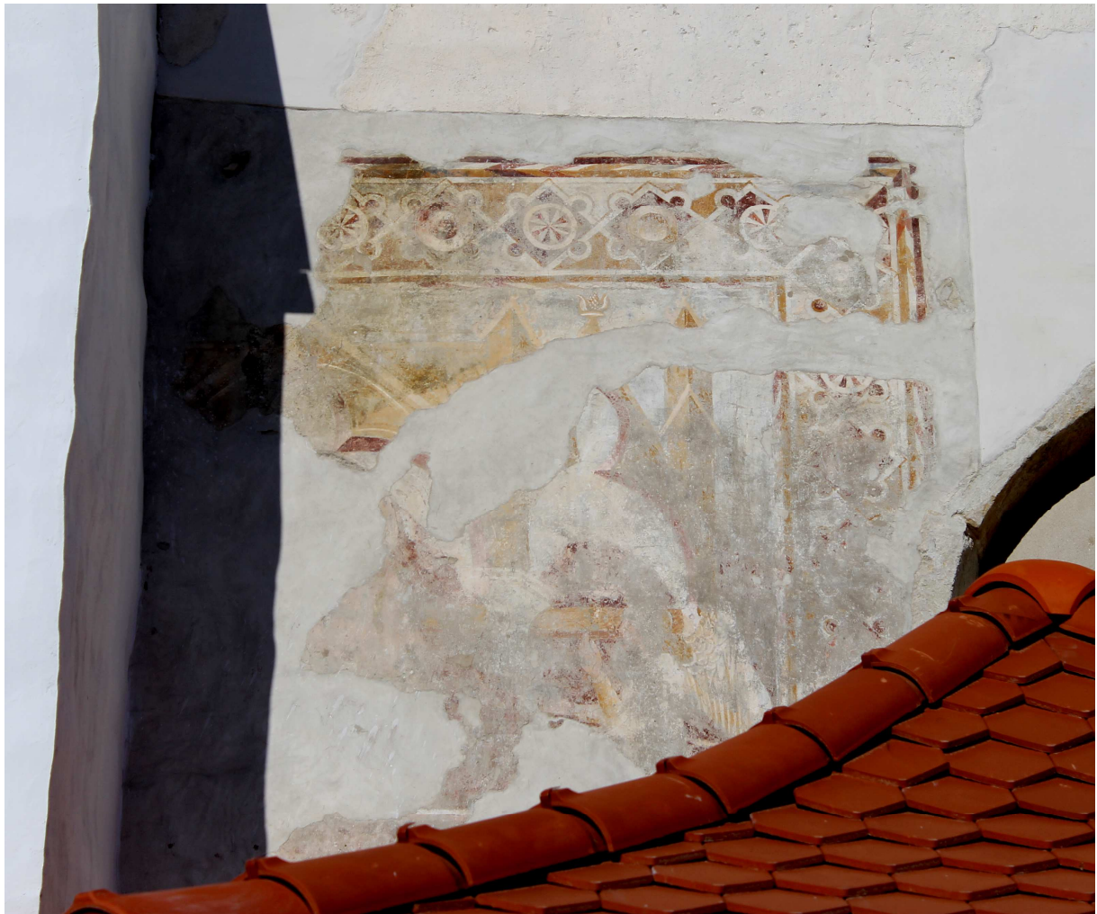
A középkori falfestmény konzerválás után.