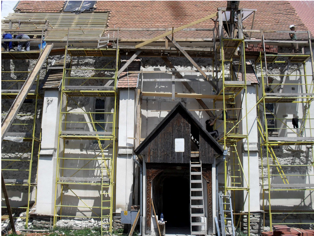
A déli homlokzat a külső falképek feltárása közben

-A csúcsíves ablakkeret részleges kibontásra került, mélyedésében egy anyagában színezett sötétebb árnyalatú visszakapart vakolatot alkalmaztunk.