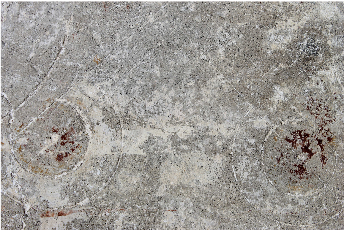
Részlet a keretdíszből. Láthatóak a bekarcolt szerkesztővonalak. Ezen a részen a festékréteg 90% eplusztult.