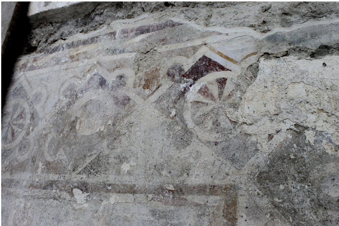
A keretdísz tisztítása