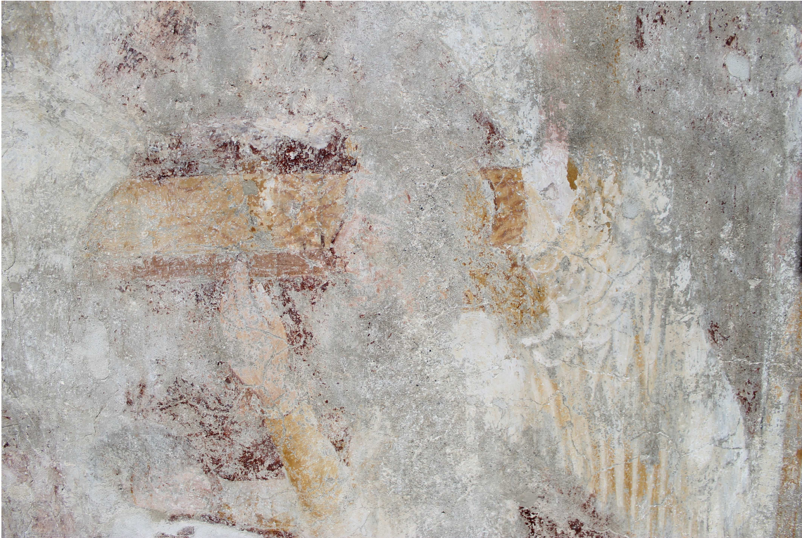
Angyal töredékes alakja a jobb oldali fülkében.