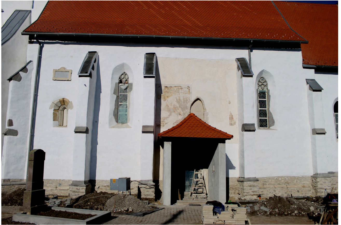
A déli homlokzat az állványzat elbontása után