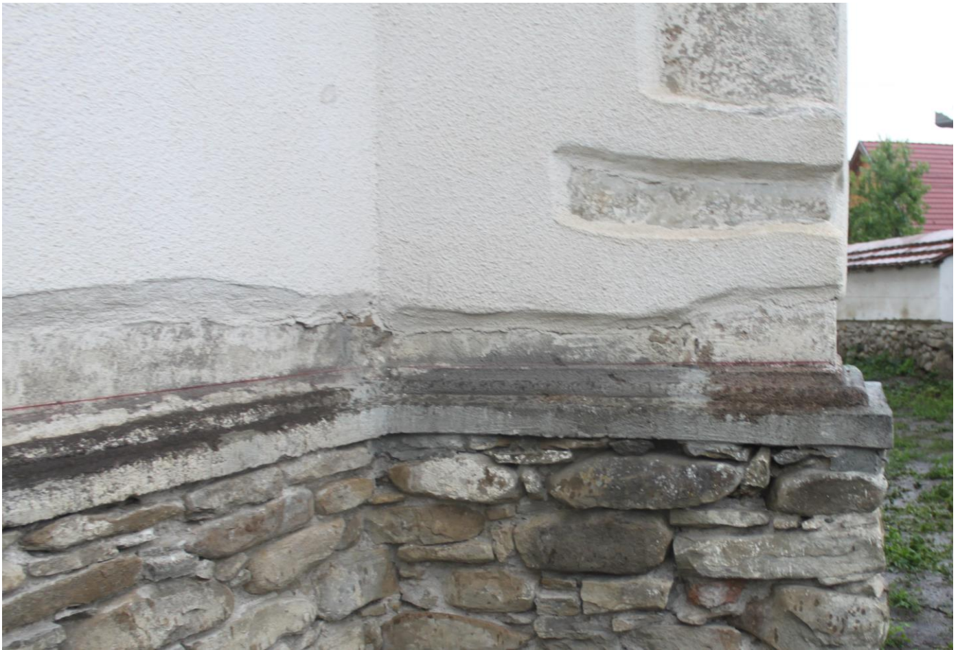
Restaurálás előtti gótikus lábazati profil biológiai szennyeződésse, korábbi cementes kiegészítésekkel, mészrétegekkel a kövek felületén