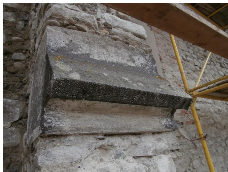
Támpillér csepegtető különböző lerakódásokkal, biológiai szennyeződéssel, mészréteggel