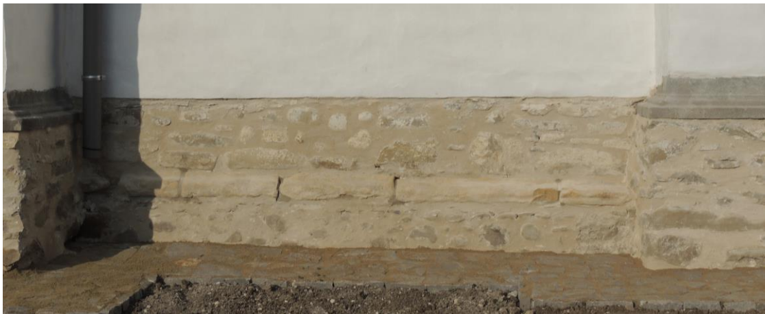
Konzervált románkori lábazat