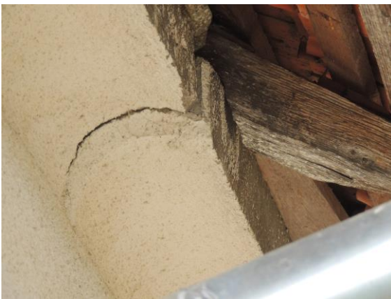
Restaurálás előtti ereszpárkány, cementréteggel