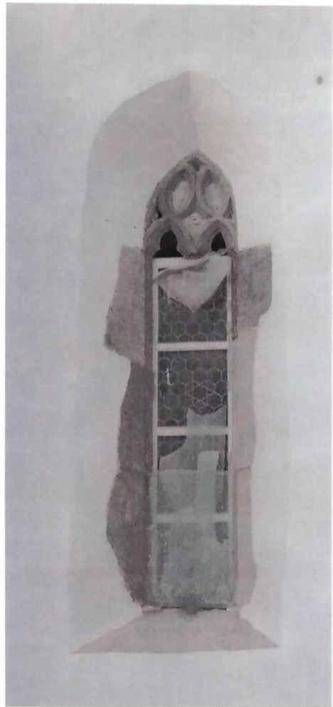
Konzervált, letisztított gótikus ablakkeretek

Jelen munkabeszámoló és a hozzá tartozó pénzügyi beszámoló az Új Ezredév Alapítvány által támogatott munkafolyamatokra vonatkozik.