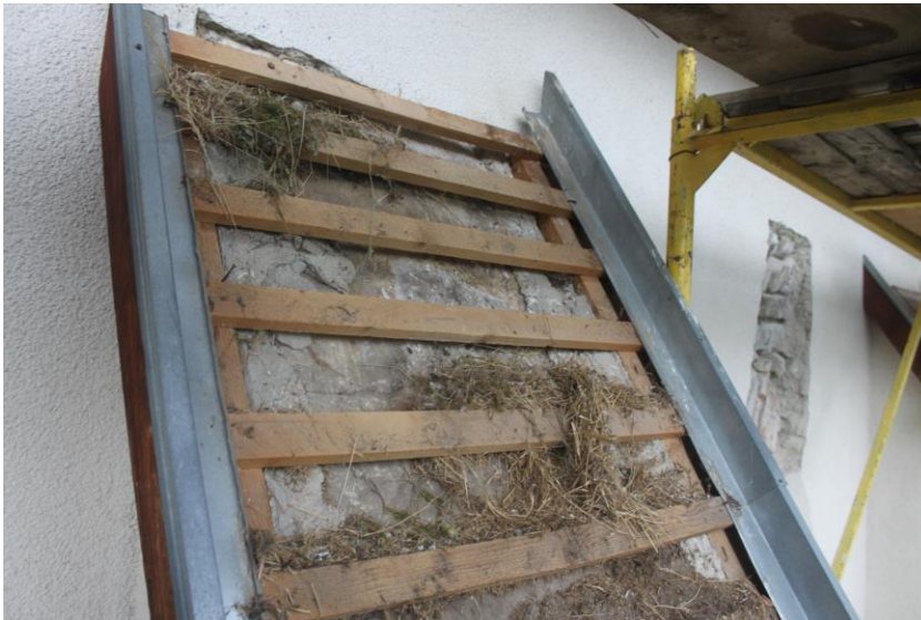
Támpillérek fedkövei a cserepek eltávolítása után