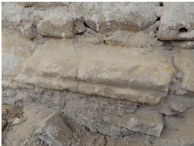
Restaurálás előtti románkori lábazati profil