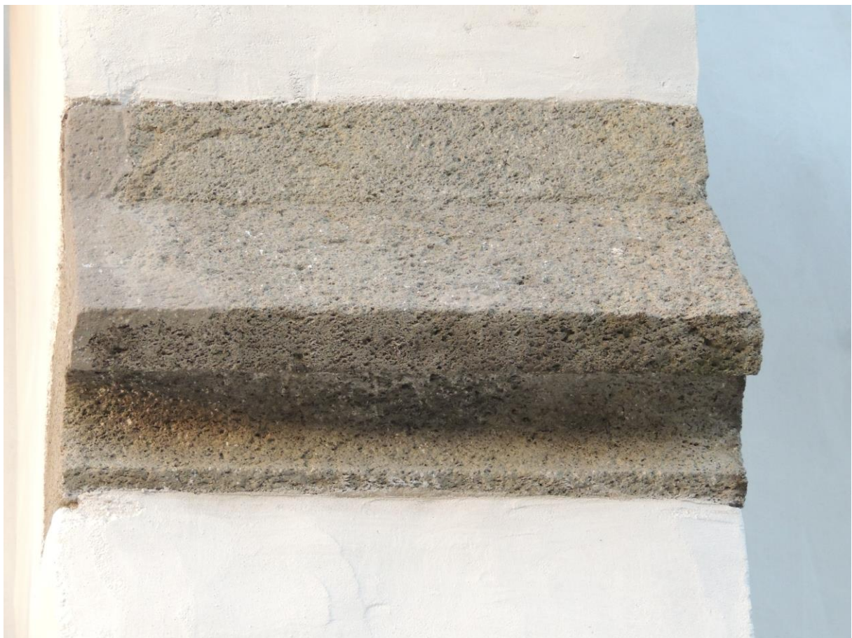
Konzervált, restaurált támpillér csepegtető