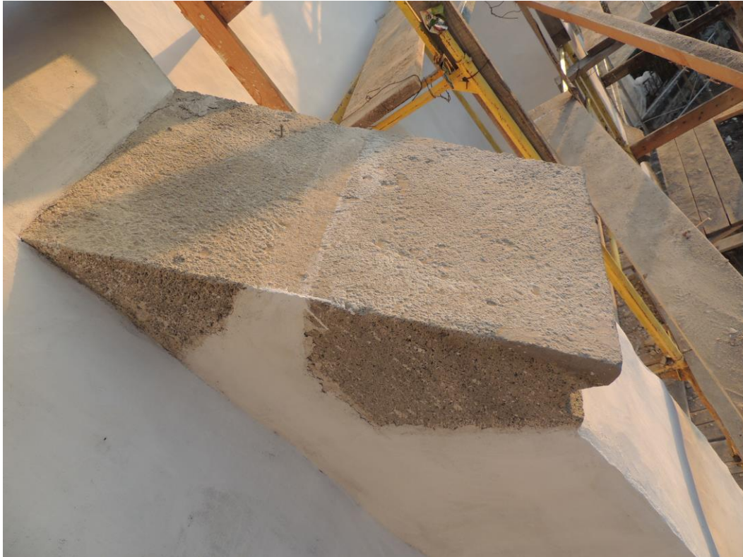
Konzervált – restaurált, a lemez fogadására előkészített támpillér fedőkővek