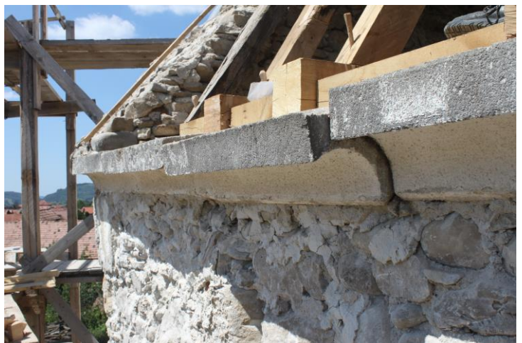
Restaurálás előtti, helyéről kimozdult ereszpárkány