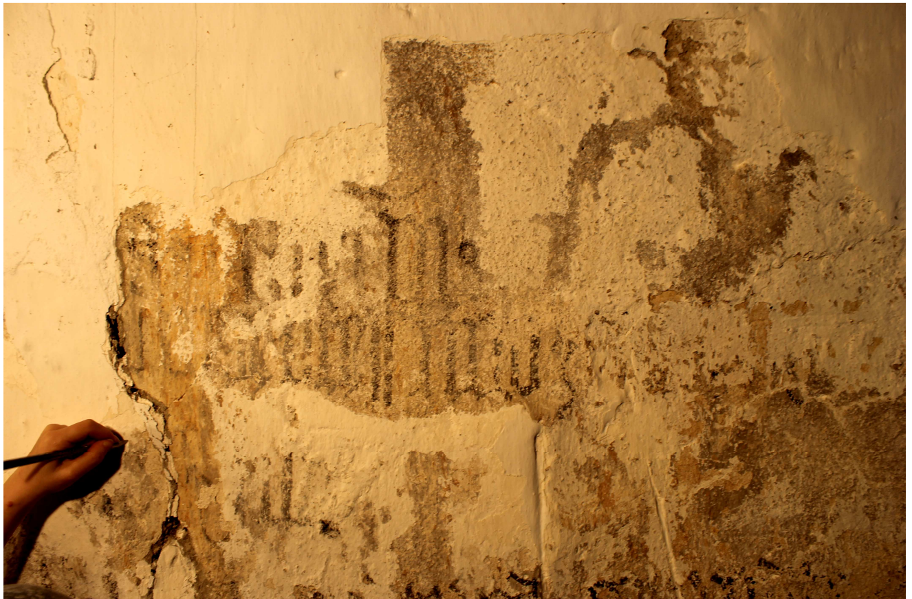
A felirat feltárása, az utólagos mészrétegek eltávolítása.