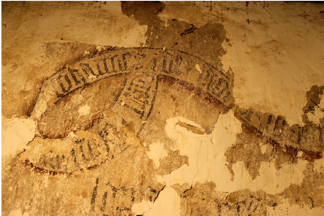
A feliratos szalag feltárása