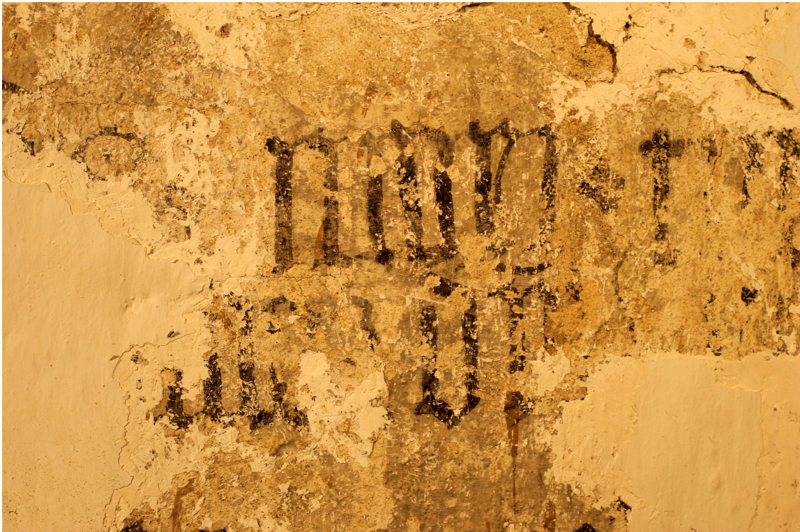
A felirat secco technikával készült emiatt rendkívül körülményes volt a jó megtartású utólagos mészrétegek eltávolítása