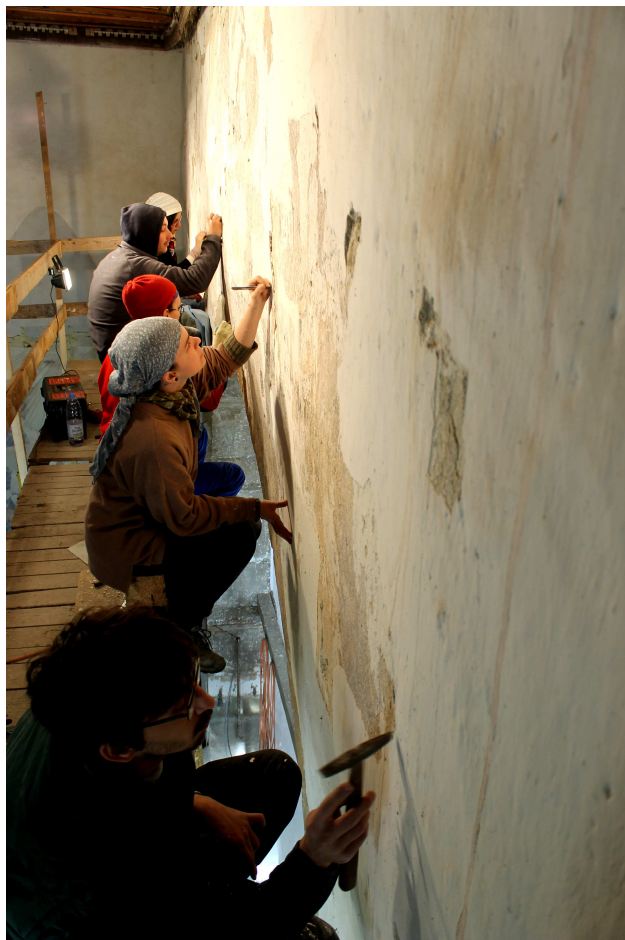
A diadalív középkori felirata restaurálás közben